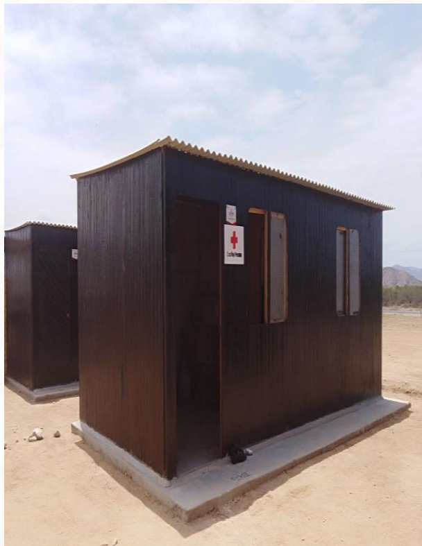
Alojamiento de 18 m 2 con dos ambientes interiores, madera machimbrada, piso de concreto