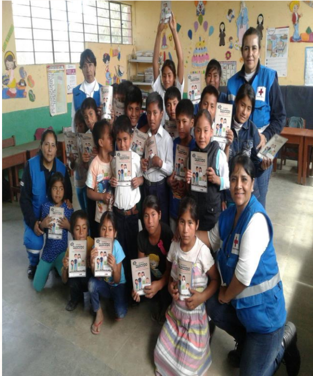
Prevención de enfermedades, zika, chikungunya