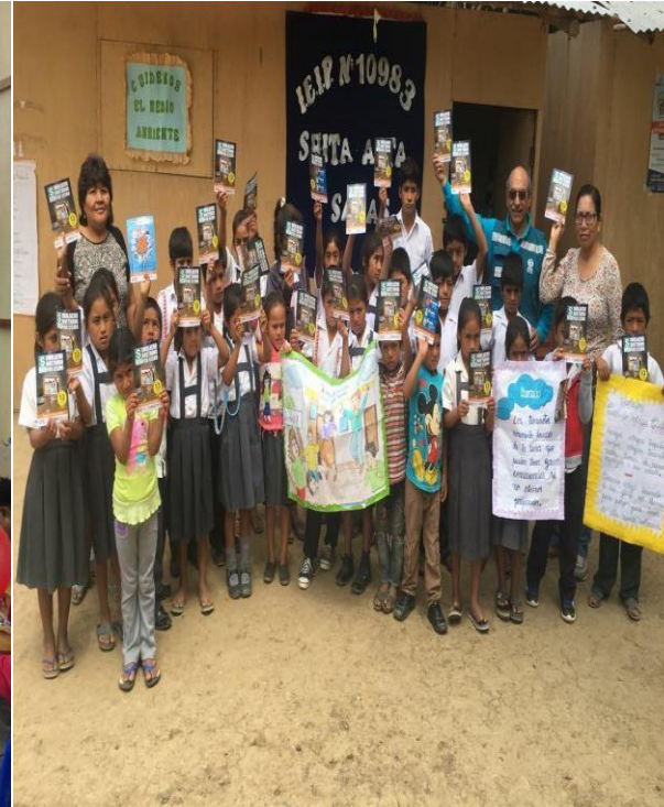
Talleres de Prevención de la Violencia familiar e infantil en las localidades de la Región Piura y Chiclayo.