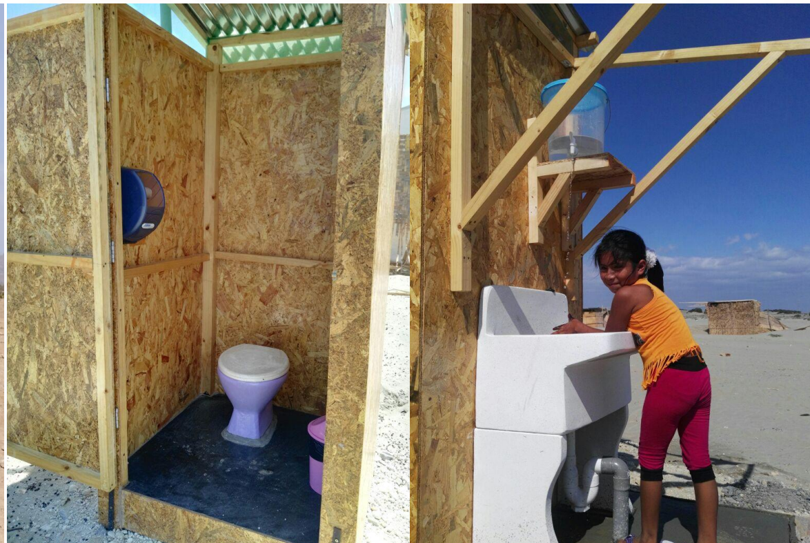
Inodoro, kits de mantenimiento y de higiene personal