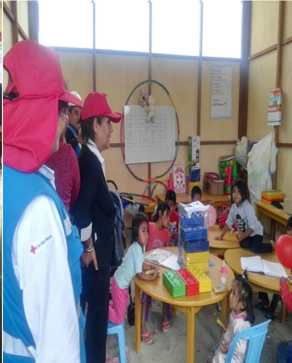
Mejoramiento del Centro Infantil, Localidad Eleuterio Cisneros- Piura