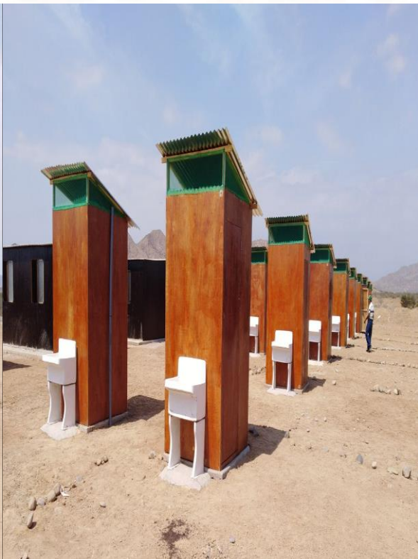
Letrina de hoyo seco con lavadero con tubo de salida de 2 m.