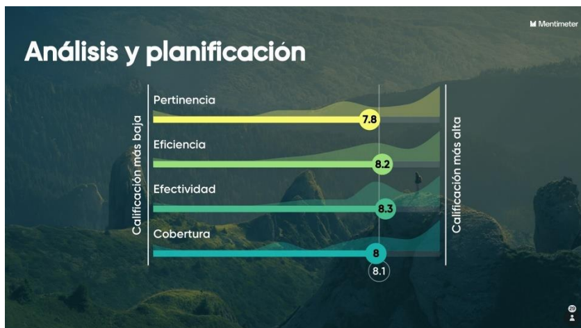
Figura 3. Taller de Lecciones Aprendidas. Ciudad de Panamá, 3 de febrero de 2024. Fuente: IFRC.

Al finalizar el taller los participantes valoraron con una calificación del 1 al 10 los criterios de evaluación (pertinencia, eficiencia, efectividad y cobertura) dentro de cada una de las áreas PER seleccionadas. La calificación promedio más alta fue obtenida por Capacidad Operacional (8.4), seguida por Soporte a Operaciones (8.3) y Análisis y Planificación (8.1). Los resultados por criterio de evaluación se muestran a continuación.