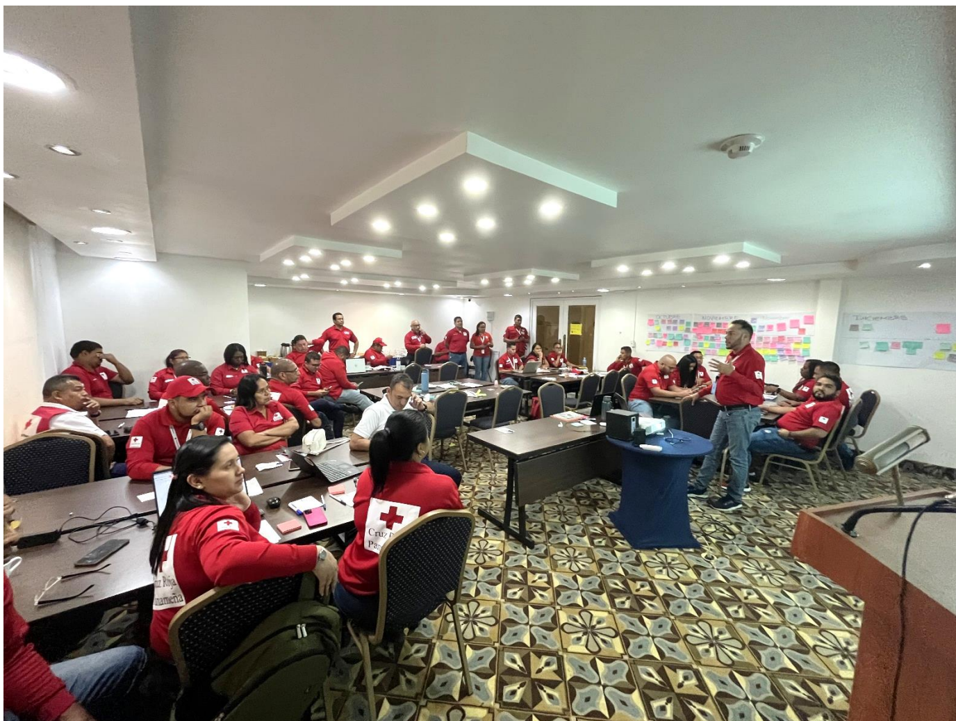
Taller de Lecciones Aprendidas. Ciudad de Panamá, 3 de febrero de 2024.

En un constante compromiso por elevar la capacidad de respuesta en situaciones de emergencia de la Cruz Roja Panameña, se presenta este informe de lecciones aprendidas. A través de un análisis amplio de la experiencia del IFRC-DREF 1 para dar respuesta a la emergencia en Panamá por disturbios civiles, se han identificado de manera conjunta valiosas lecciones y oportunidades de mejora que orientan hacia operaciones de emergencia futuras más efectivas y pertinentes.