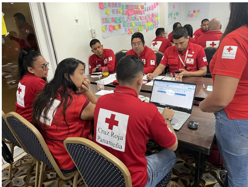
Figura 4. Taller de Lecciones Aprendidas. Ciudad de Panamá, 3 de febrero de 2024.

En el siguiente enlace se pueden visualizar las fotografías del taller.